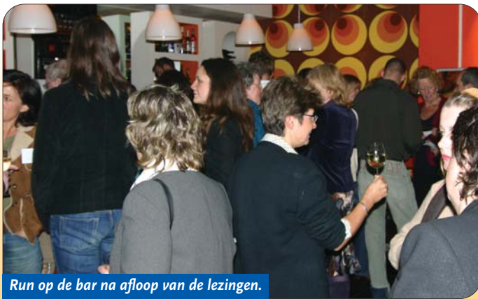
Run op de bar na afloop van de lezingen.

SVE-leden en introducés waren het erover eens bij vertrek uit het gezellige Ondernemerscafé aan de Hooikade in Den Haag: het was een inspirerende en levendige bijeenkomst geweest waar volop ideeën uitgewisseld waren over allerlei mogelijke samenwerkingsverbanden.