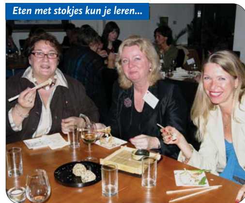
Eten met stokjes kun je leren...